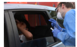
Corona-Zahlen steigen wieder: 1.735 Neuinfektionen