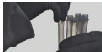
Corona-Notstand in der Slowakei: Österreichs Bundesheer soll helfen