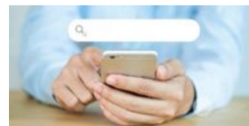
Google: Suchmaschine mit neuem Design