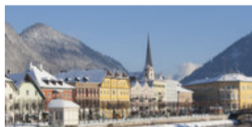
Südafrika-Mutation: Öffentlicher Aufruf im Salzkammergut