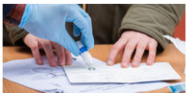
Schul-Tests: So viele Schüler waren positiv